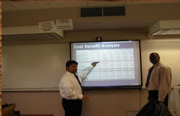
Presentasi Ide & gagasan