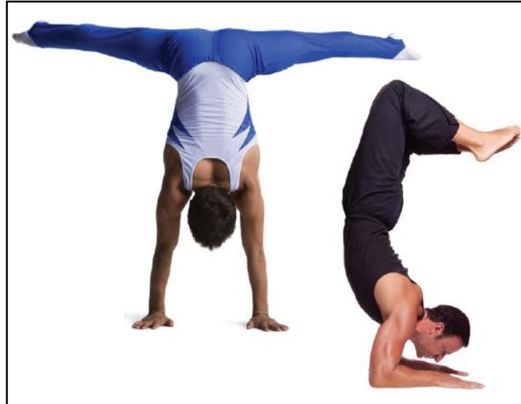
Gambar 2. Atlet melatih keseimbangan (Hede, C. & Russell, K. & Weatherby, R., 2010)

Keseimbangan statis terjadi pada tubuh yang tidak bergerak. Keseimbangan dinamis yaitu terjadi ketika tubuh bergerak (Reffil, 2009). Bagaimana mengontrol keseimbangan ini, selain dapat dilatihkan harus dapat dipelajari, yaitu dalam mekanika, kesetimbangan.