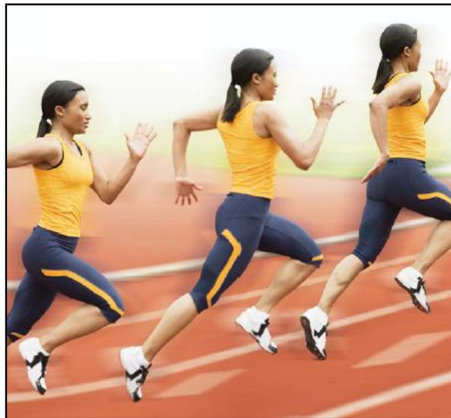
Gambar 1. Gerak lurus adalah ketika seseorang berlari pada garis lurus (Hede, C. & Russell, K. & Weatherby, R., 2010)

Seperti dikemukakan di atas, dalam biomekanika yang mempelajari tubuh sebagai mesin, banyak yang dapat dijelaskan dalam kerja tubuh dari aspek sains sebagai bentuk keterpaduan antara sains dalam keolahragaan. Berikut ini adalah beberapa contoh penerapan sains yang menjelaskan peranannya dalam keolahragaan, misalnya; gerak, keseimbangan dan stabilitas, serta dalam mekanika fluida (Biomechanics, 2013). Gerak adalah bagian yang selalu ada dalam keolahragaan. Atlet dan bola atau semua penerapannya memerlukan perubahan posisi yang tetap. Hakikat perubahan ini dalam posisi tergantung banyak faktor. Gerak lurus terjadi ketika benda atau, dalam kasus keolahragaan, tubuh manusia, tungkai/lengan atau benda dijaga manusia, bergerak dalam garis lurus. Suatu contoh gerak lurus adalah ketika seseorang berlari pada garis lurus. Sedang ketika gerakanya membentuk lengkungan, disebut gerak lengkung, salah satu contohnya adalah pada tenis terjadi pada saat melakukan lob shot . Dalam hal ini banyak dibicarakan tentang kelajuan, kecepatan, percepatan, perlambatan dan momentum.