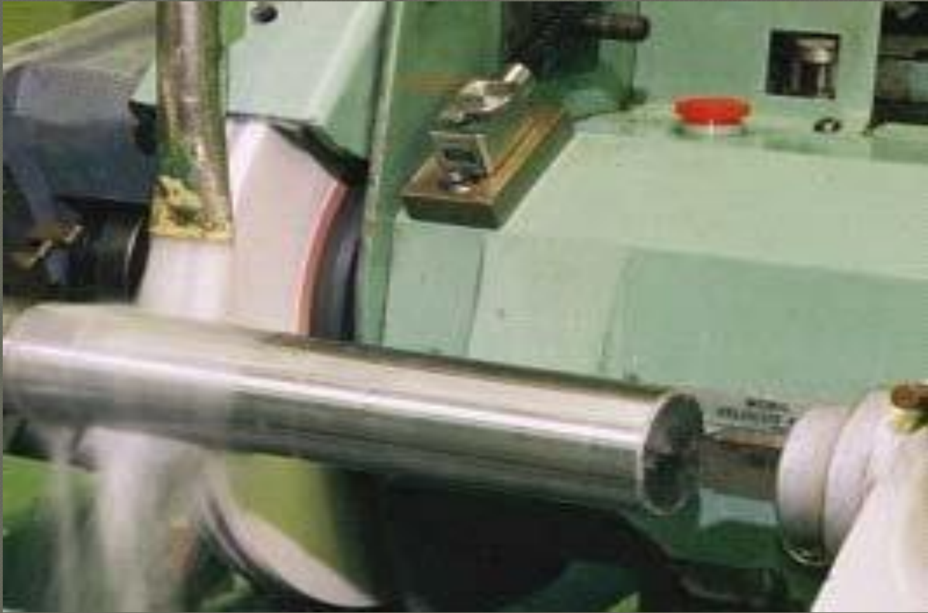
External cyl. grinding