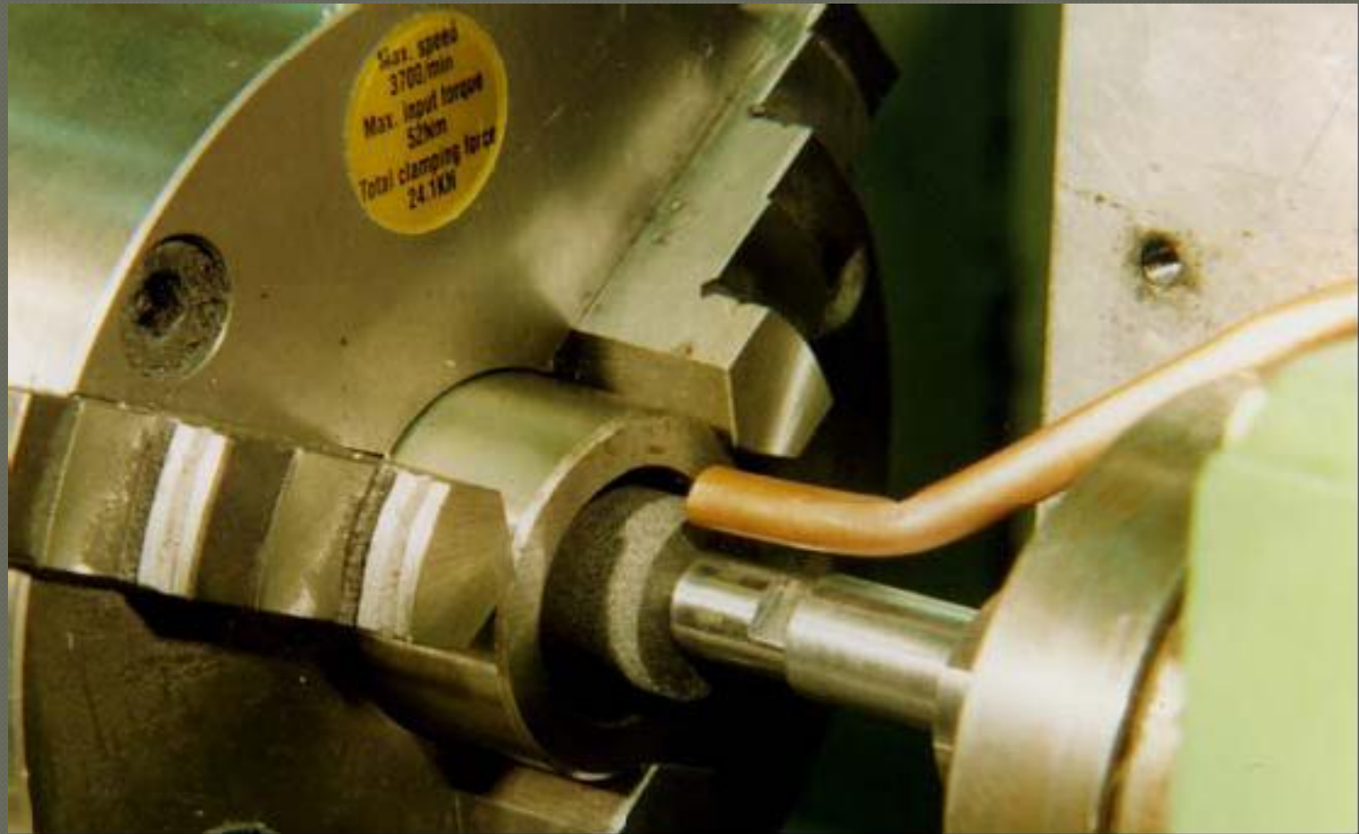
Internal cyl. grinding