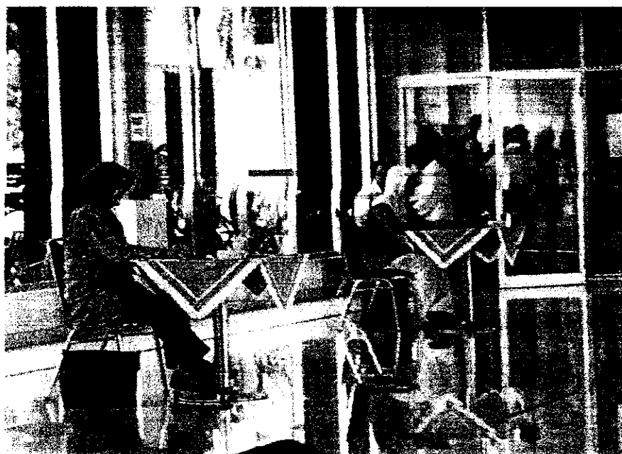
Dokumentasi 2. Dewan Juri Lomba Senam