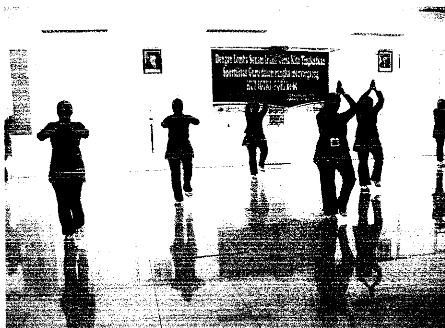
Dokumentasi Pelaksanaan Lomba Senam