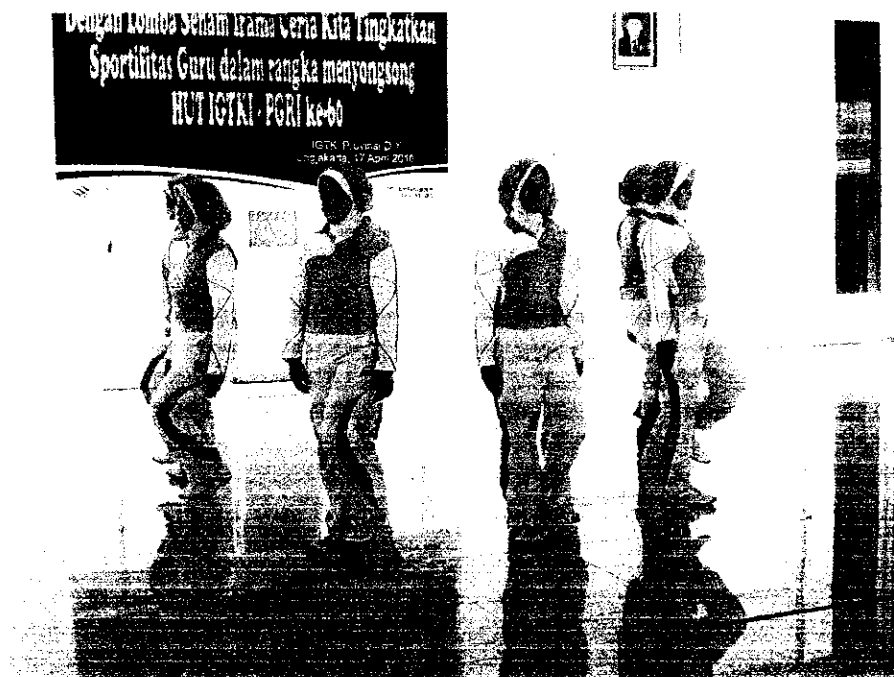
Dokumentasi Pelaksanaan Lomba Senam