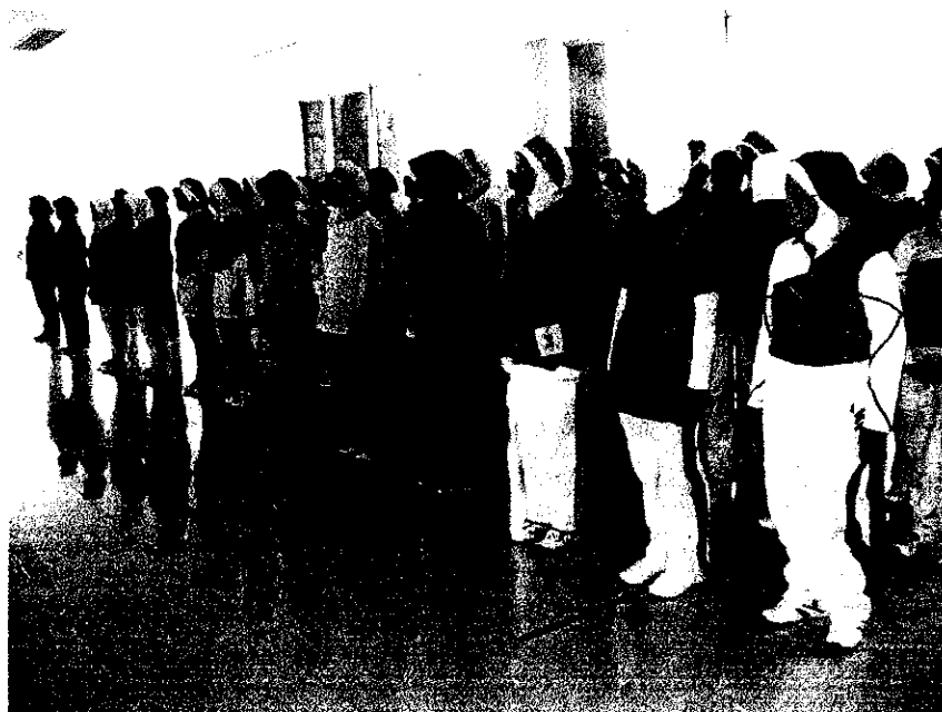
Dokumentasi 1. Foto Peserta Lomba Senam