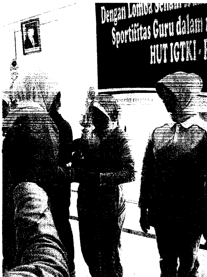
Dokumentasi Penyerahan Tropi kepada Juara