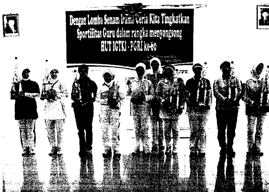
Dokumentasi Para Juara Lomba Senam