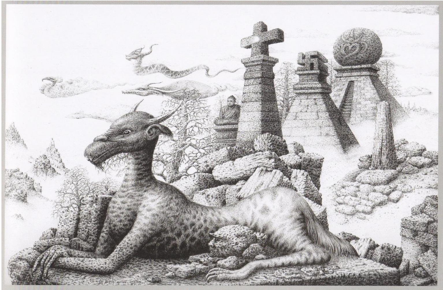
Misteri Bali- Monumen Multi Kultur - Zona Nyaman