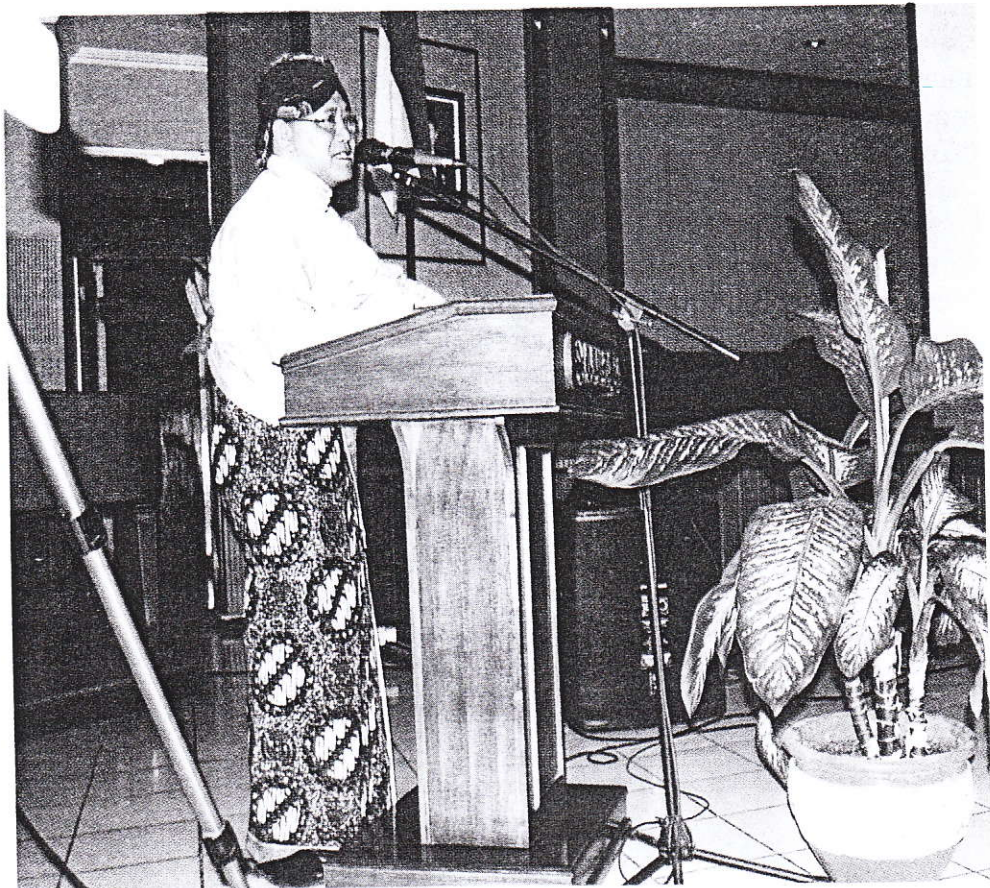
Gambar tiyang ingkang nembé sesorah

Tuladha teks sesorah ingkang ngrembag bab basa Jawi ing sekolah.