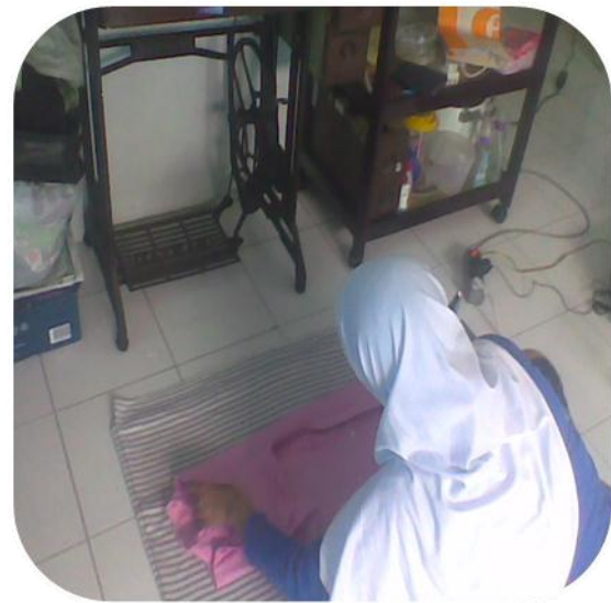
SETRIKA BAJU JADI