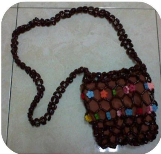
TAS TALI PANJANG