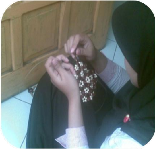
PEMBUATAN / MERANGKAI