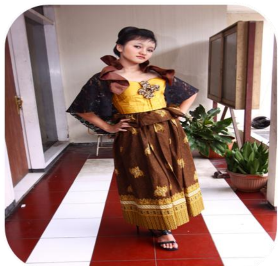
GAUN BATIK TIDAR