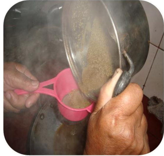
REBUS DAN SARING (I)