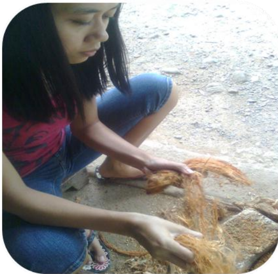
PEMISAHAN SABUT KELAPA