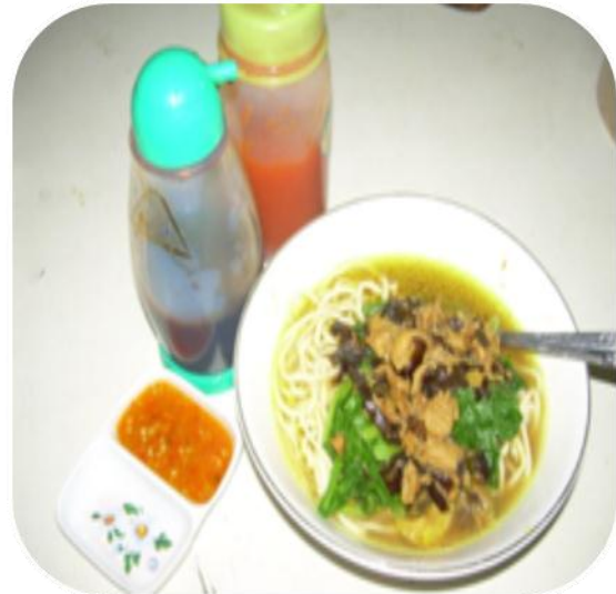
MIE AYAM JAMUR