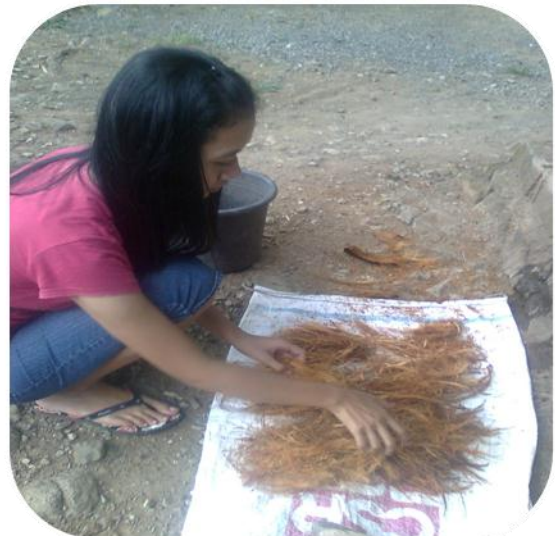
PENGERINGAN / JEMUR