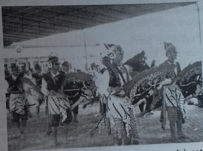
Gambar 3 Jathilan dengan gerak sederhana, salah satu ciri jathilan untuk upacara