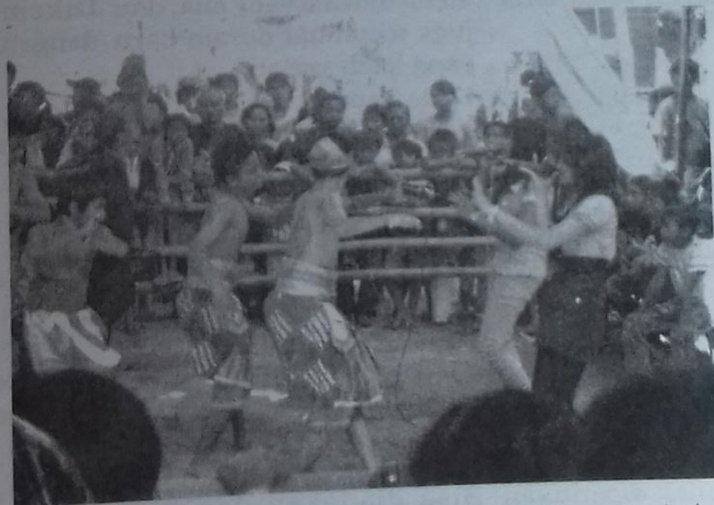
Gambar 1. Penari yang sedang trance , berinteraksi dengan penyanyi campursari dalam irama dangdut

Secara umum penyajian kesenian jathilan yang berkembang di kota Yogyakarta selain jathilan gaul , tidak banyak berubah. Bahkan dari pengakuan salah seorang tokoh Sutopo Tejo Baskoro, jathilan di kota Yogyakarta lebih banyak dipengaruhi oleh jathilan yang berkembang di Sleman maupun Bantul.