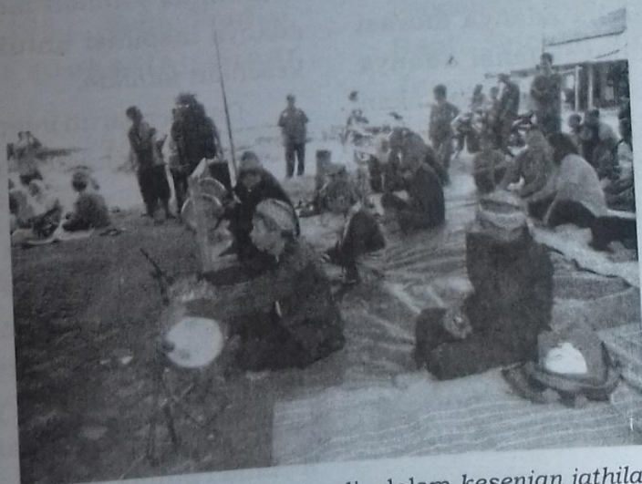
Gambar 4 Instrumen minimalis dalam kesenian jathilan seremonial terdiri atas, kendang, bende, kecer, ceng ceng dan angklung (Sumber: Dokumentasi Penulis, 2012)