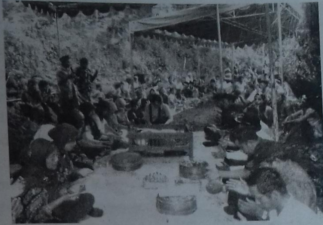
Gambar 2 Selamat sebelum pertunjukan jathilan dalam upacara “ ngguyang jaran ”