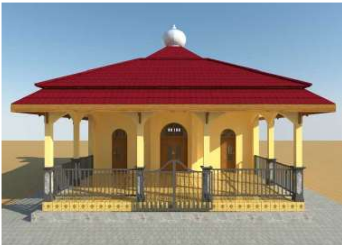
Masjid dilihat dari sisi timur (depan)