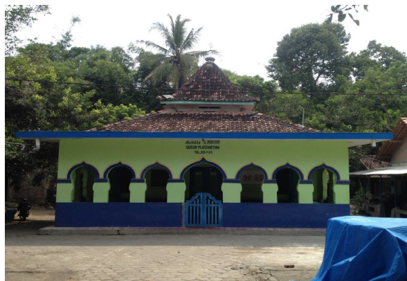
Batu bata sumbangan salah satu warga