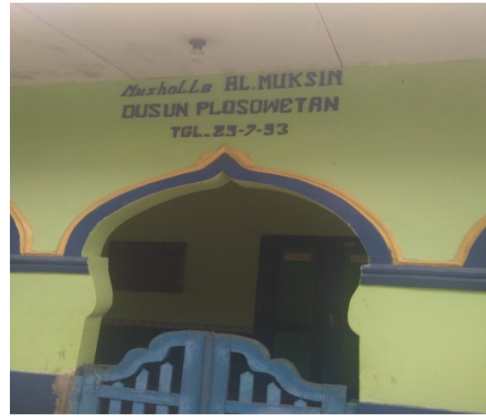
Musholla dibangun tahun 1993