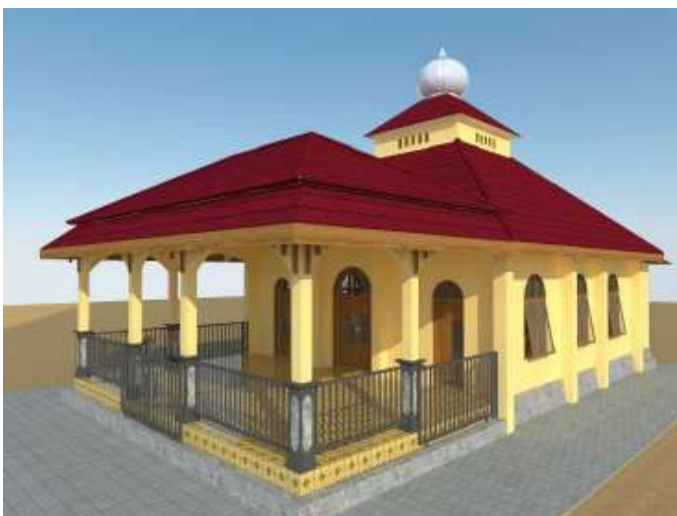
Masjid dilihat dari sisi utara