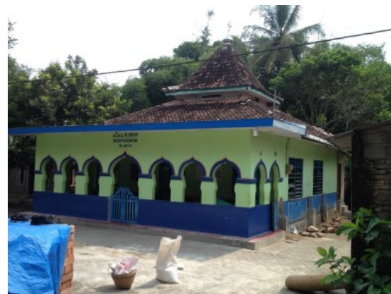
Batu sumbangan dusun