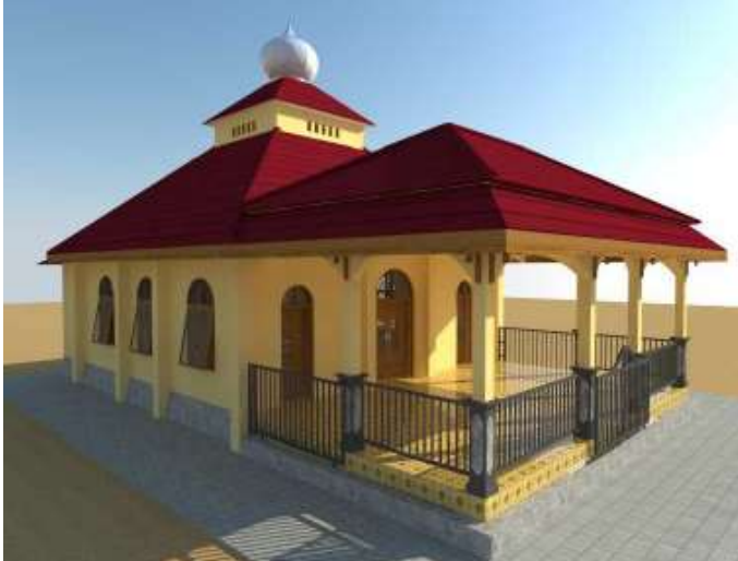
Masjid dilihat dari sisi selatan