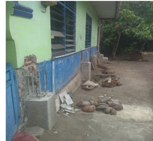
Sudah dibuat pondasi cakar ayam