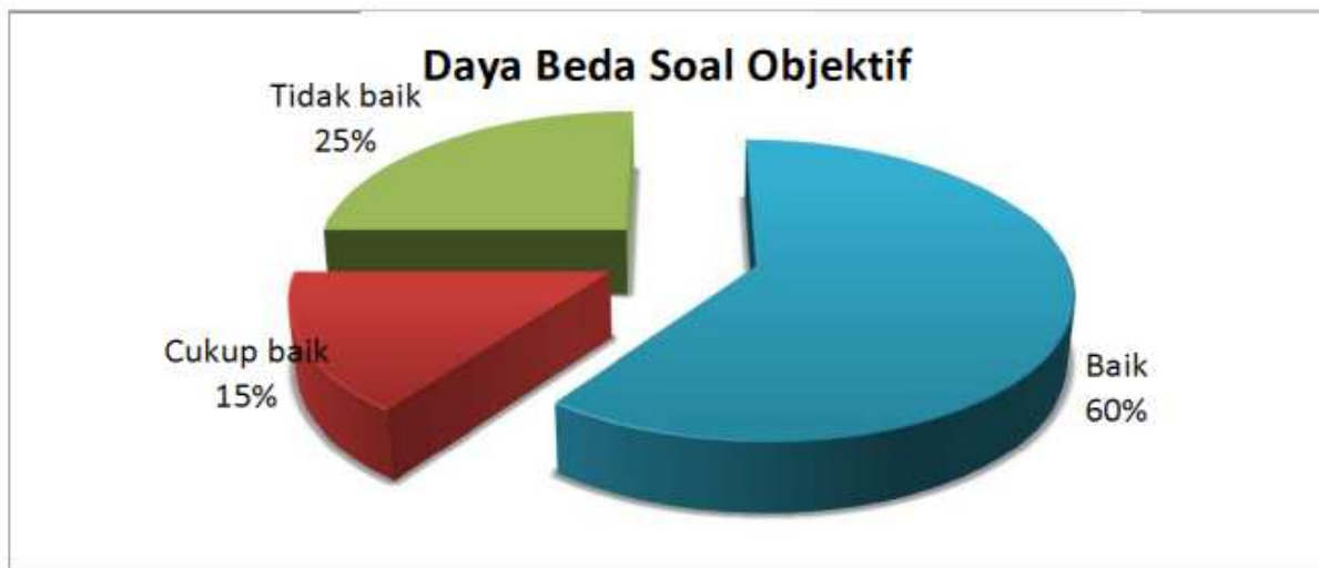
Gambar 12. Tampilan Menu Grafik Soal

Menu Grafik Soal ini berisi kualitas soal objektif dan essay dilihat dari daya beda, tingkat kesulitan dan kualitas soal. Grafik ditampilkan dalam bentuk diagram lingkaran yang menggambarkan proporsi soal yang baik, cukup baik dan tidak baik.