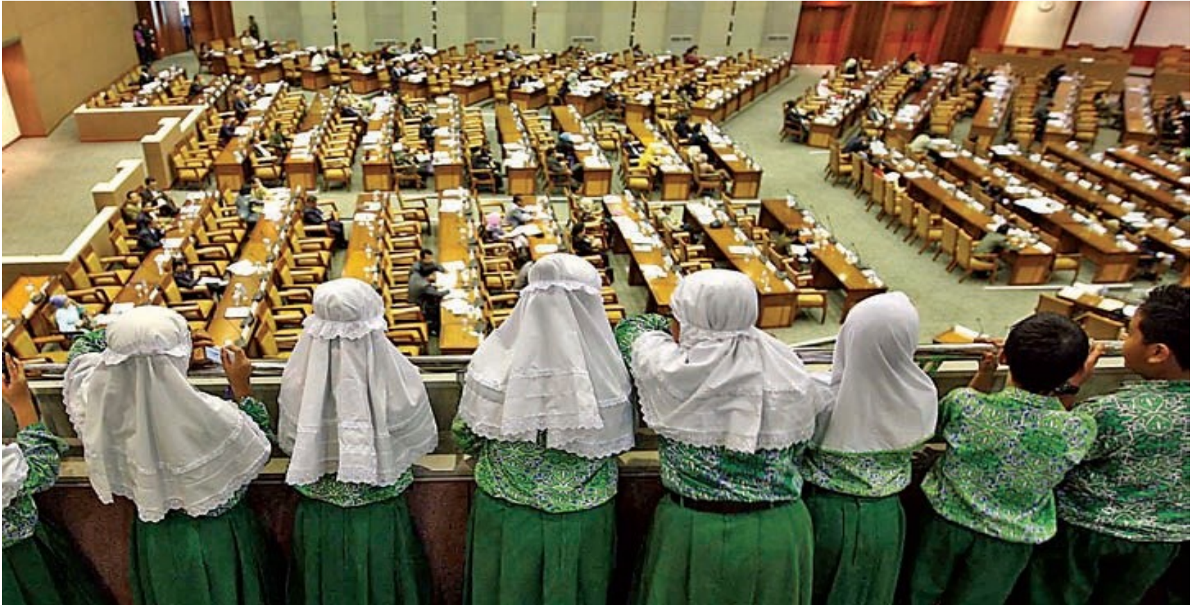
PENDIDIKAN POLITIK ANAK SD AL-AZHAR RAWAMANGUN