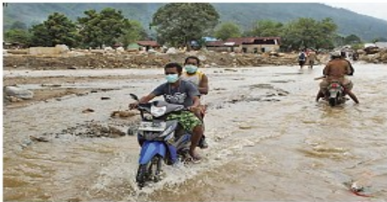
WASIORILULUH LANTAK: Kota Wasior, Papua Barat, yang dihantam banjir bandang pada Senin (4/11) terlihat luluh lantak dan helikopter pengangkut bantuan, kemarin jatuh. Alat berat untuk memperbaiki jalan pun terbalik setelah dihantam banjir (kiri) dan warga menggunakan motor melewati jalan layu yang masih beresam air (kanan).