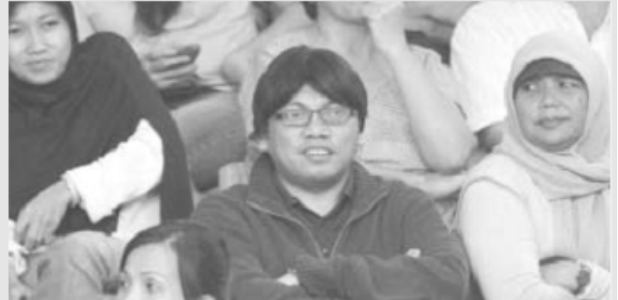
AGUS SUSANTO (KOMPAS)

HINGGA SABTU, 6 NOVEMBER Polri berkoordinasi dengan imigrasi agar Gayus dicekal ke luar negeri. Polri pun menyerahkan empat sketsa wajah Gayus dari berbagai versi.