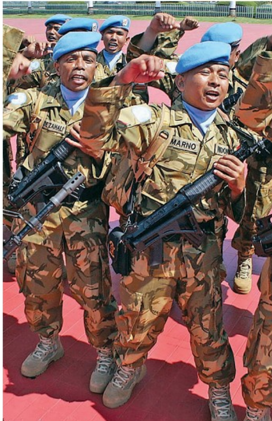
MENJUJI KONGO: Pasukan Satuan Tugas Kompi Zeni TNI Kontingen Garuda (Kongas) XX-HMMONUSOO menantikan jeli-jeli zeusa upacara pemberangkatan di Mabes TNI, Cilangkap, Jakarta, kemarin. Pasukan ini akan melaksanakan tugas memelihara perdamaian dunia di Republik Demokratik Kongo selama satu tahun.