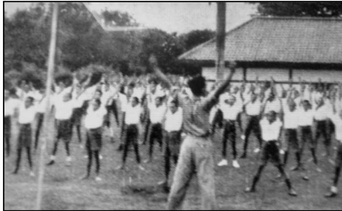
Taiso, Senam Khas Jepang

Jepang juga menggunakan lagu sebagai salah satu sarana propaganda untuk menyebarkan gagasan serta meningkatkan nilai moral dan semangat. Lagu-lagu militer dan kepahlawanan Jepang berulang-ulang diajarkan di sekolah-sekolah. Jepang menyebarkan buku-buku yang berisi tentang lagu-lagu Jepang dengan alasan untuk meningkatkan moral dan semangat sebagai sesama bangsa Asia. Namun, sebenarnya hal ini dilakukan Jepang untuk meningkatkan semangat rakyat yang hidup dalam situasi sosial ekonomi yang menyedihkan dan sebagai pengganti atau saluran pesan politik (Aiko Kurasawa, 1993: 253-254).