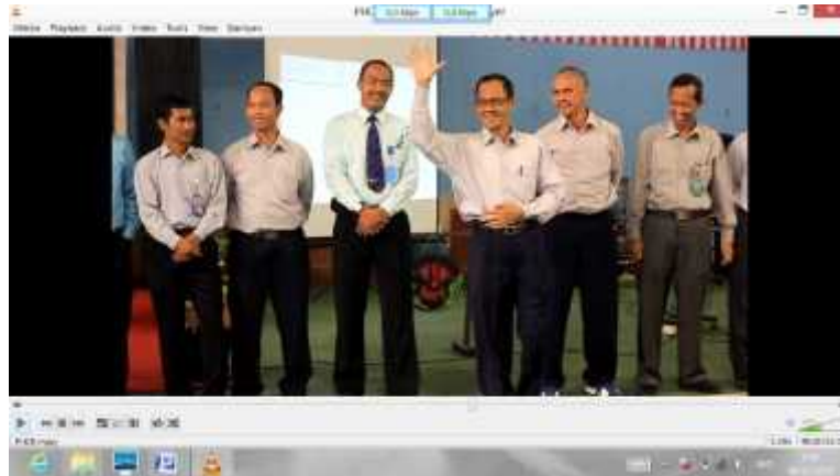
Gambar 12. Dosen POR sebelum Revisi