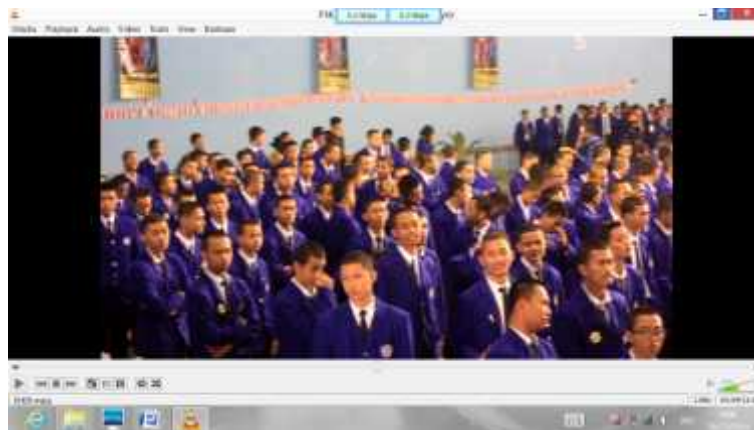
Gambar 10. Orientasi Pengenalan Kampus Sebelum Revisi