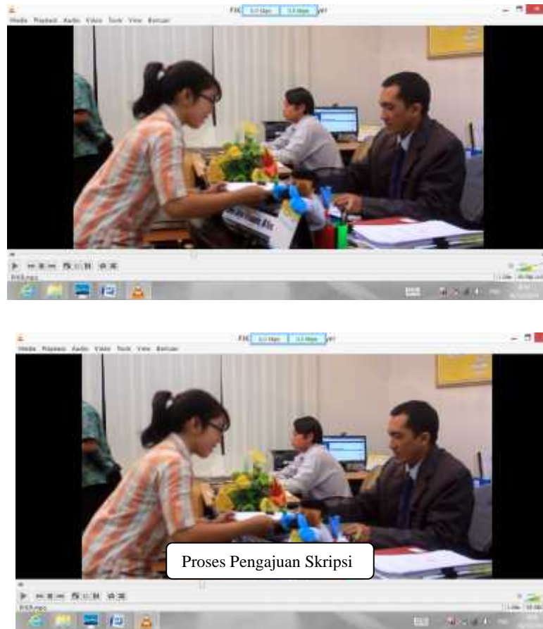
Gambar 7. Pengajuan Skripsi setelah direvisi