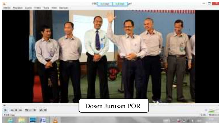
Gambar 13. Dosen POR Setelah Revisi