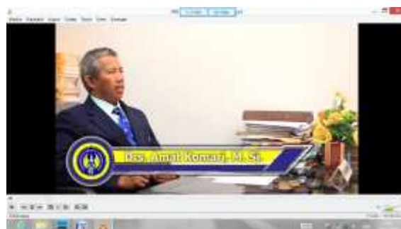
Gambar 2. Tulisan Sebelum Revisi