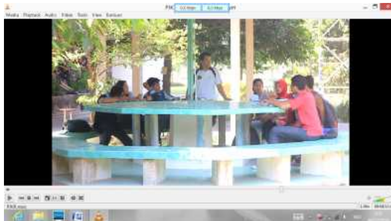
Gambar 16. Proses Pembelajaran Sebelum Revisi