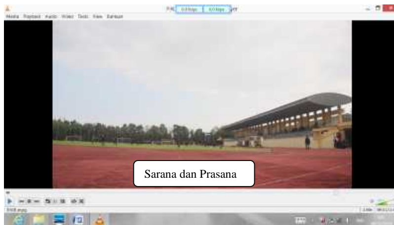
Gambar 21. Sarana dan Prasarana Setelah Direvisi