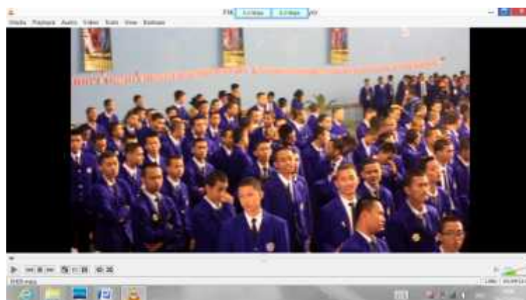
Gambar 11. Orientasi Pengenalan Kampus Setelah Revisi