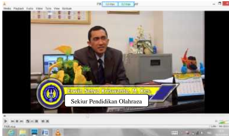
Gambar 9. Tulisan Setelah Direvisi