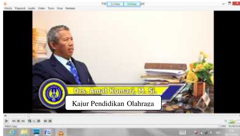
Gambar 3. Tulisan Setelah Revisi