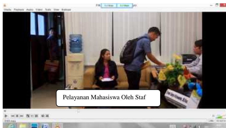
Gambar 5. Penambahan Tulisan setelah Revisi