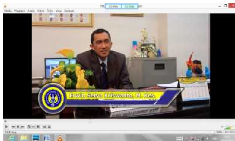
Gambar 8. Tulisan Sebelum Direvisi