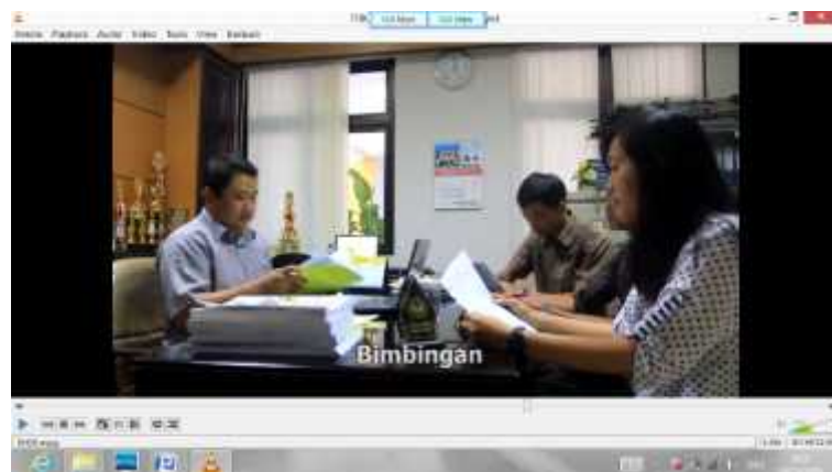
Gambar 14. Bimbingan Skripsi Sebelum Revisi