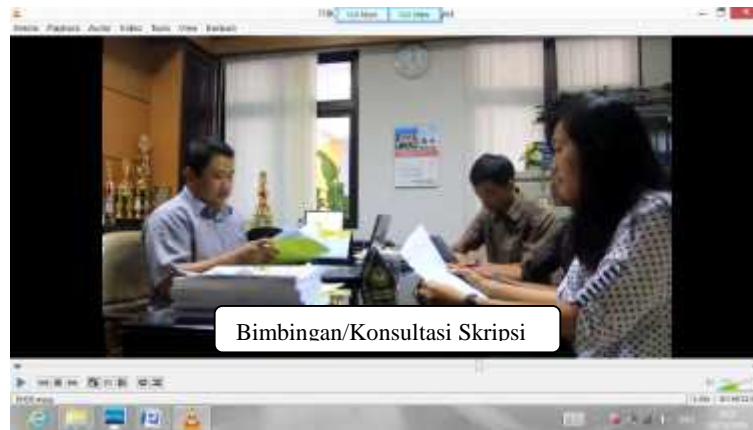
Gambar 15. Bimbingan Skripsi Setelah Revisi