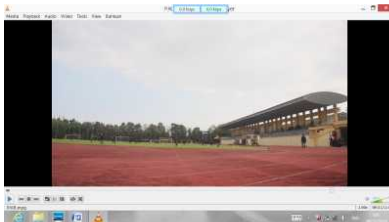
Gambar 20. Sarana dan Prasarana Sebelum Direvisi