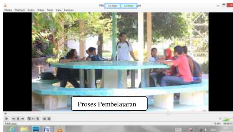
Gambar 17. Proses Pembelajaran Setelah Revisi