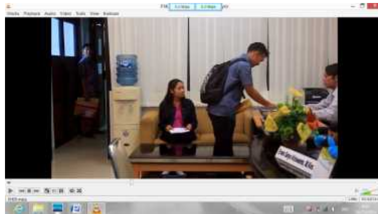
Gambar 4. Pelayanan belum ada tulisan sebelum Revisi