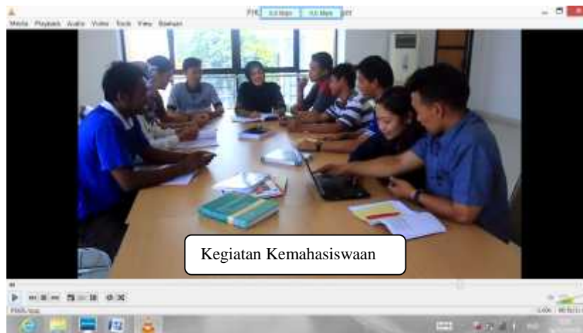
Gambar 19. Kegiatan Kemahasiswaan Setelah Revisi