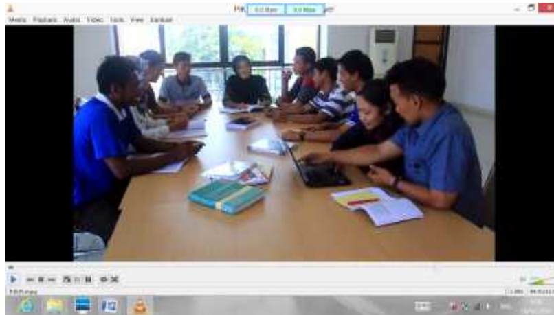
Gambar 18. Kegiatan Kemahasiswaan Sebelum Revisi