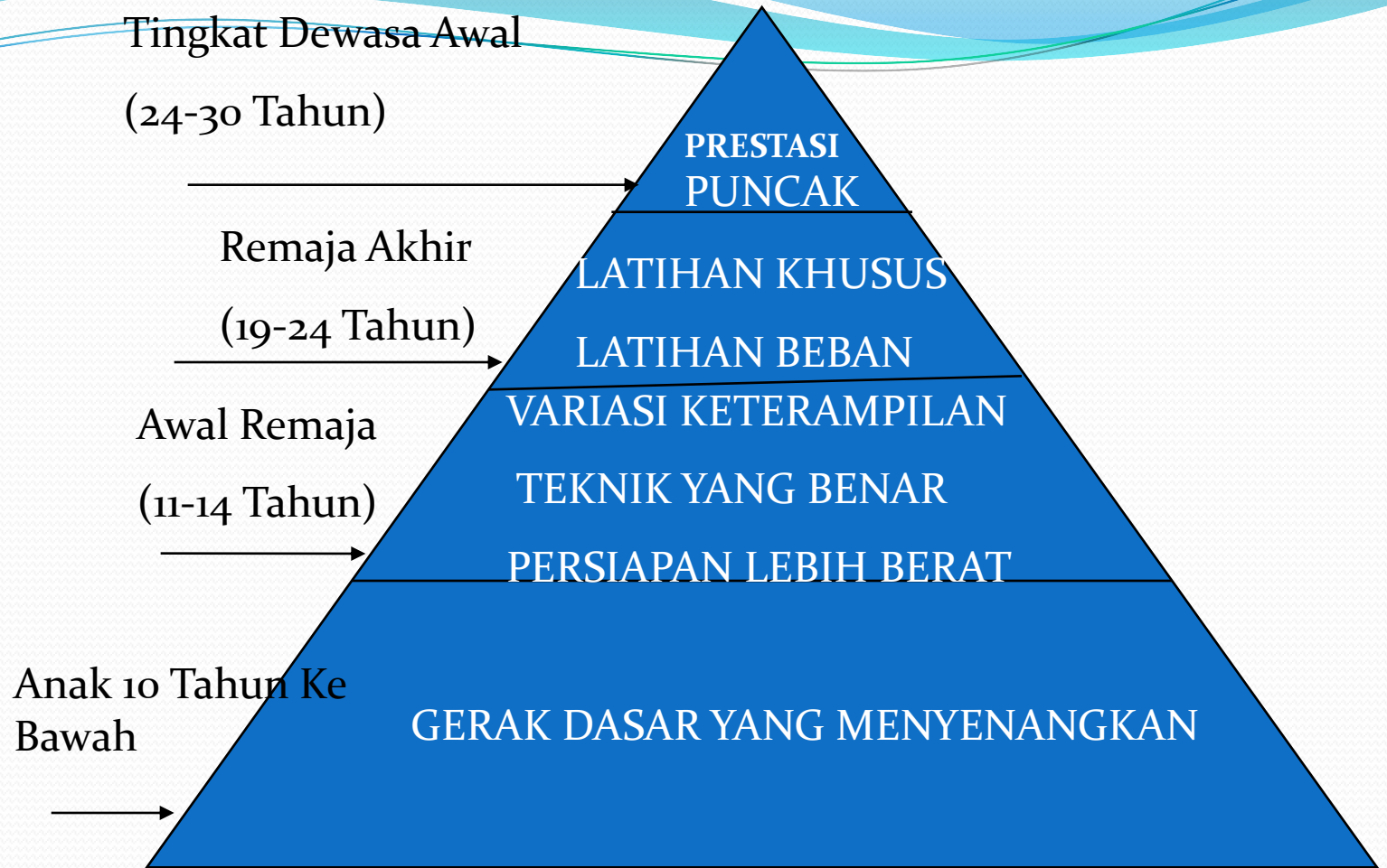
Piramida Latihan Berdasarkan Usia