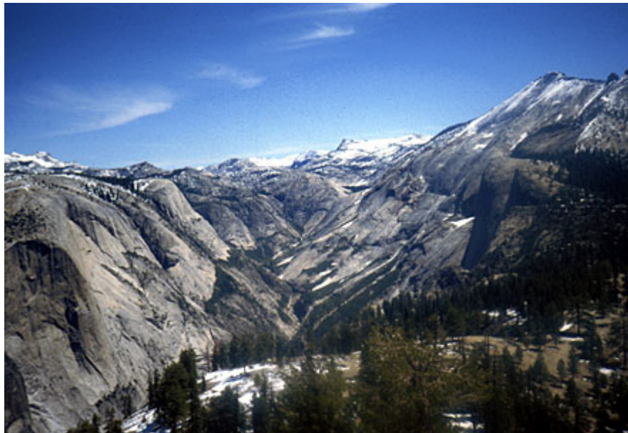
Pegunungan Sierra merupakan contoh pegunungan blok-patahan.

Pegunungan blok terbentuk jika kerak Bumi patah dan terangkat ke atas di sepanjang garis sesar. Contoh pegunungan ini adalah Pegunungan Sierra di Nevada.