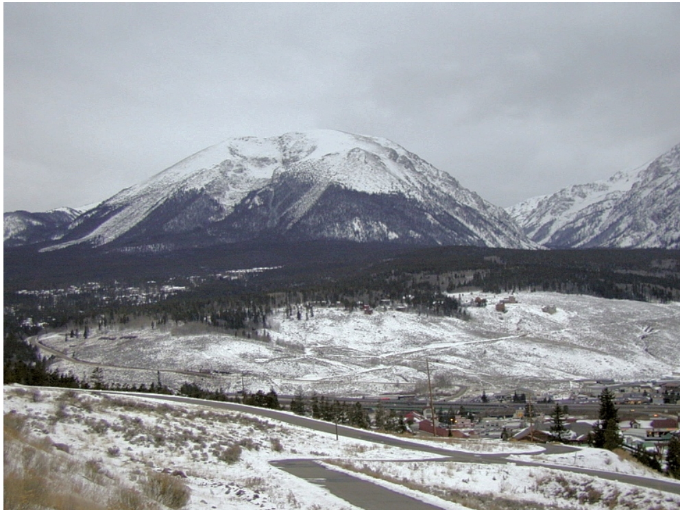
Pegunungan Rocky. Salah satu contoh pegunungan kubah.