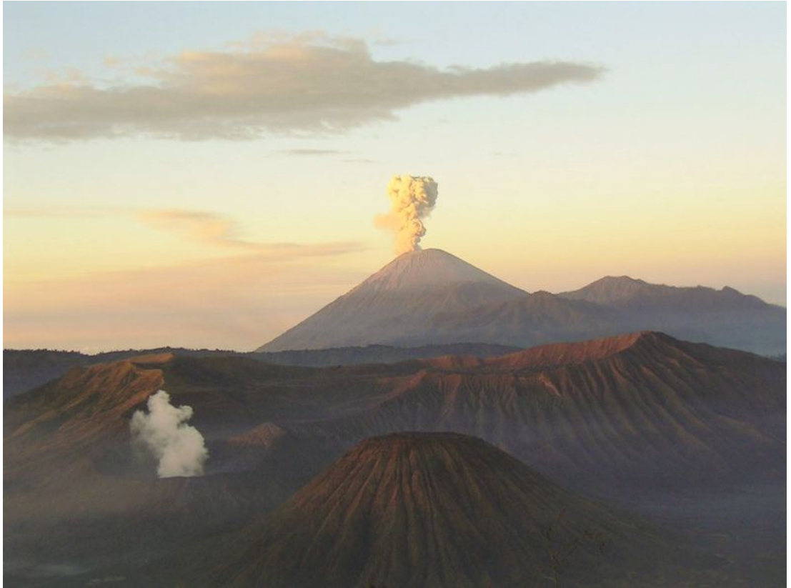
Di bagian belakang adalah Gunung Mahameru atau Semeru. Di depannya terdapat kaldera Gunung Bromo. Keduanya terletak di Jawa Timur.