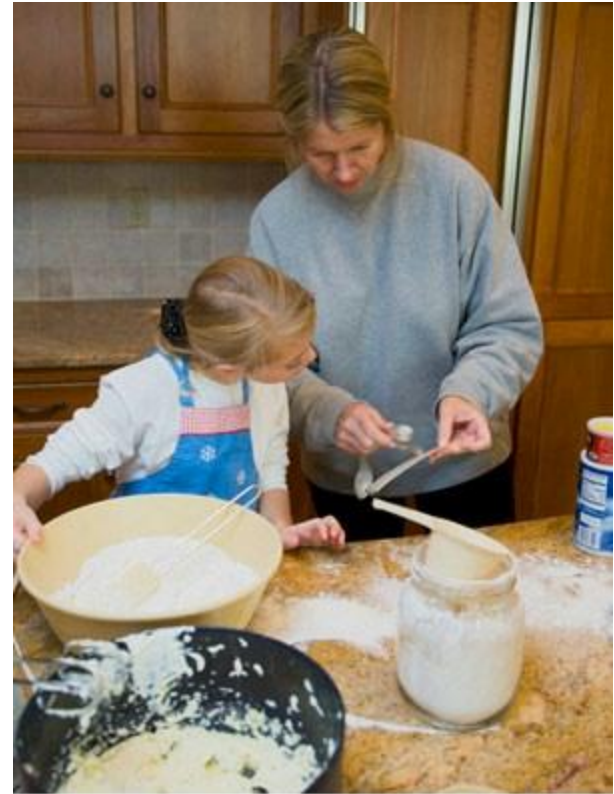
"Mula-mula masukkan tepung... lepas tu..."