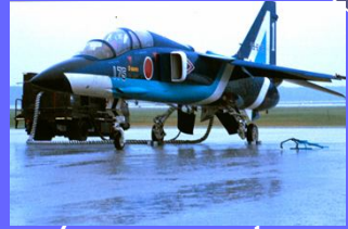
(pesawat yang diacu) Ekstralingual