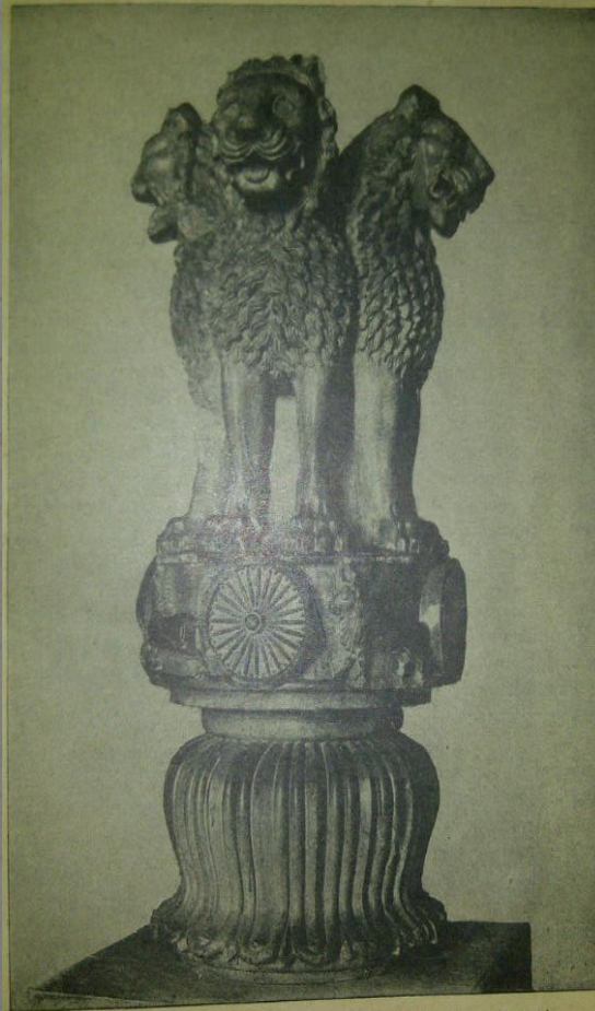
CAPITAL OF AŠOKAN PILLAR, SÁRNÁTH (NEAR BENARES)