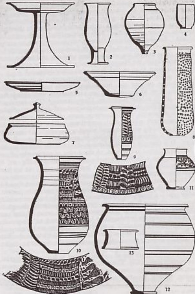
FIG. 12. Pottery from Cemetery R 37, Harappā. Scale: 2, 3-7, 11, 13; remainder, 1/2.