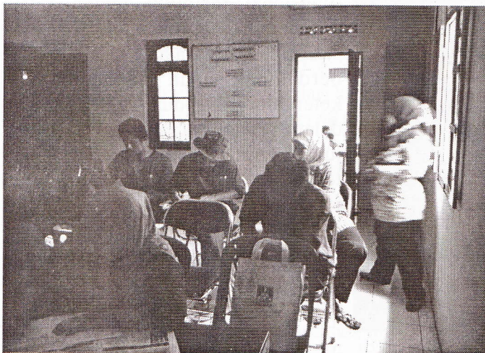
Foto 1. FGD antara aksarawan program KF, pengelola dan peneliti

Penelitian ini dilengkapi dengan metode Focus Group Discussion (FGD) antara peneliti dan sumber data dalam hal ini adalah para pengelola PKBM, TBM dan Program Koran Ibu