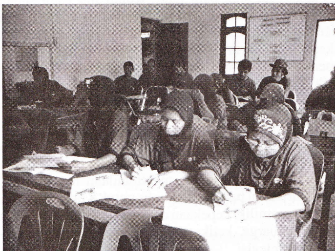
Foto 3. Para aksarawan perempuan melakukan kegiatan belajar menulis tulisan bebas di PKBM

Dari hasil wawancara kepada para pengelola Koran Ibu di PKBM Wiyatasari, program dan kegiatan penyelenggaraan Koran Ibu cukup membantu dalam mempermudah proses pembelajaran keaksaraan fungsional, apalagi secara substansi Koran Ibu juga menyajikan tips-tips bertani, resep, penanaman tanaman kesehatan yang dapat digunakan sebagai bahan diskusi para aksarawan perempuan dalam menambah keterampilan di bidang pertanian misalnya. Menurutnya, Koran Ibu merupakan tempat menuangkan gagasan dan ide dari para ibu rumah tangga buta aksara, yang berasal dari keluarga tidak mampu. "Mereka melatih kemampuan beraksara mereka melalui tulisan, ini merupakan media belajar mereka,". Ketika peneliti menggunakan metode membaca dan menulis untuk mengetahui keterampilan membaca dan menulis, maka diketahui sebagian besar sudah mampu menuliskan gagasan hasil meniru persis dan meniru dengan memodifikasi sebuah tulisan. Dari 19 orang ibu, dua orang ibu yang masih tampak kesulitan untuk membaca dan menulis seperti yang lainnya. Menurut hasil penelitian menunjukkan bahwa Koran Ibu dicetak antara lain untuk diberikan secara gratis kepada para aksarawan perempuan sebagai media pembelajaran program