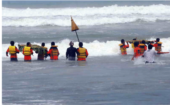
Labuhan ing Samodra Kidul