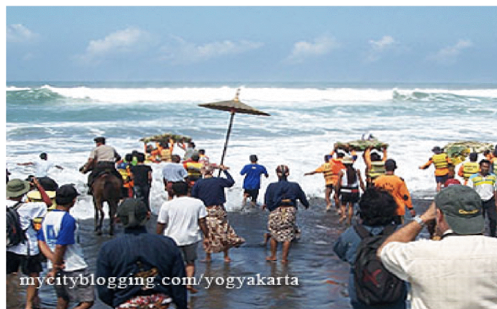
Labuhan Samodra Kidul

Labuhan dipunwiwiti ing Pendhapa Kecamatan Kretek, Bantul 3 km saking gisiking samodra. Ubarampe kabekta dhateng Cepuri Parangkusuma. Lajeng katata ing Pendaha Parangkusumo, tigang tandhu bambo isi ubarampe. Papan menika wonten sela karang ingkang sinebat sela gilang, papan patemon Panembahan Senapati kaliyan Kanjeng Ratu Kidul. Puji pandonga kawiwitan. Ing wanci siyang ngajengaken bedhug, sedaya ubarampe ing jodhang katandhu lajeng kalabuh ing segara kidul. Para abdi dalem, wisawatan samya rebutan ngalap berkah kagungan Ngarsa Dalem.