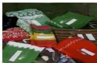
Manekawarna semekan agemaning wanita