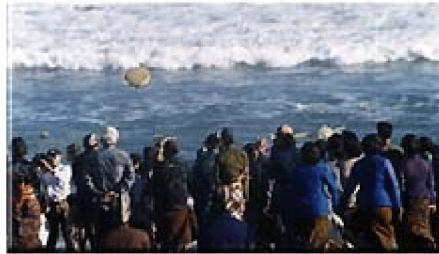
Labuhan ing Samodra Kidul

saking Panembahan Senapati ngantos tedhak turunipun. Kajawi menika ugi wonten rajuting asmara antawisipun Ratu Kidul kaliyan Panembahan Senapati ngantos tedhak turunipun.