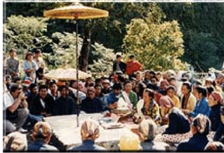
Donga ing Labuhan Merapi

musna ados alusan. Dening Panembahan Senapati, Ki Juru Taman kadhawuhan mapan wonten ing Gunung Merapi njagi Gunung Merapi supados boten ngamuk (njeblog) sewanci-wanci. Minangka tetimbanganipun saben tahun Kraton Ngayogyakarta nindakaken pisungsung labuhan. Ki Juru Taman lajeng kondhang kasebat Eyang Sapujagad.