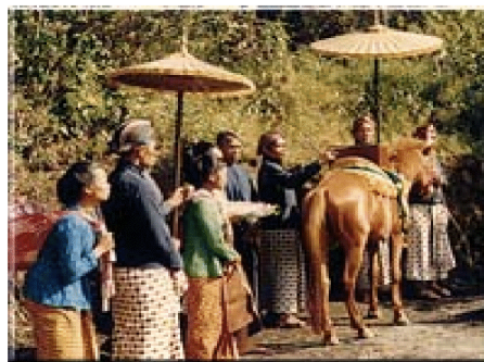
Bidhal Labuhan Merapi

Inggang kaasta ing Labuhan Merapi sami kaliyan Labuhan Lawu. Utusan Dalem bidhal tumuju dhateng Dhusun Kinahreja kanthi juru kunci Mbah Marijan utawi Mas Ngabehi Suraksaharga. Tabuh 4 enjing utusan lajeng minggah pucuk Kendhit (kirang langkung 2,5 jam). Sedaya ubarampe lajeng kalabuh.