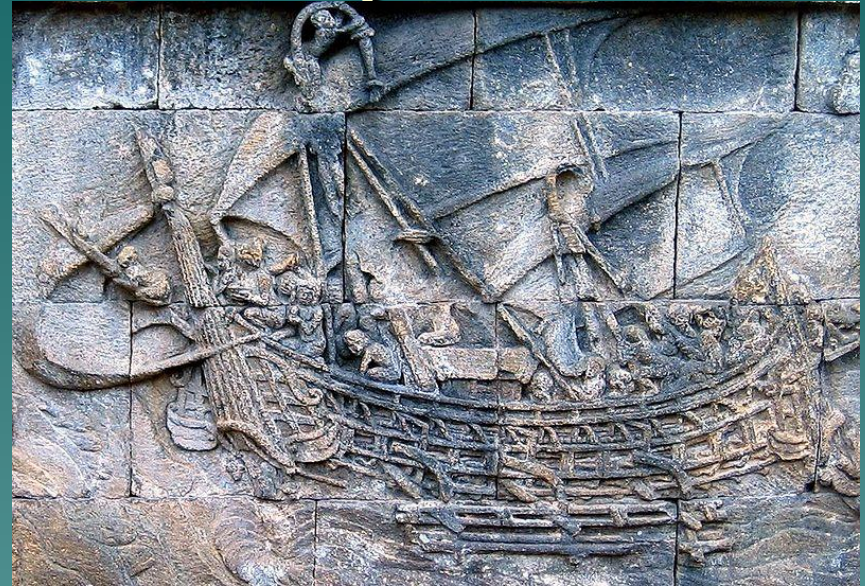
Picture of traditional ship from 8 th century Borobudur monument, Central Java